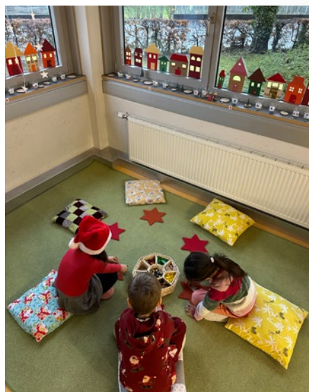
@ Kindergarten Dorf