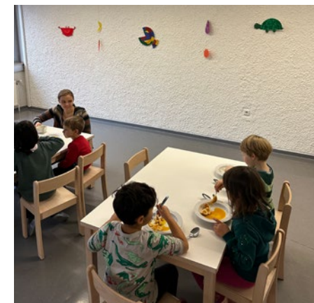
@ Kindergarten Dorf

achtsam in der Gemeinschaft der anderen genießen zu können. Für alle Kinder die länger als bis 13:00 Uhr im Kindergarten bleiben, gibt es bei uns ein warmes Mittagessen das von der SeneCura mit viel Liebe zubereitet wird. Die Kinder dürfen dann gemeinsam und in Ruhe ihr Mittagessen genießen. So erfahren die Kinder, das Essen auch etwas Geselliges ist, das unserer Wertschätzung und Wahrnehmung bedarf.