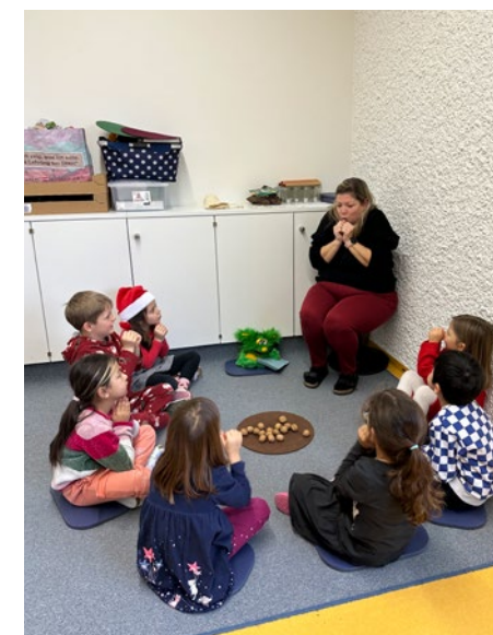
Elementare Musikpädagogik, @ Kindergarten Dorf

Sich besser spüren lernen, soll das Ziel sein und um es zu erreichen, müssen alle Sinne gut zusammenspielen. In unserem Kindergarten arbeiten wir mit einem besonderem Sensoriktsch, der alle paar Wochen für die Kinder neu befüllt wird. Die von uns ausgewählten Materialien regen die Sinneswahrnehmung der Kinder an und laden ein zum täglichen Fühlen und erforschen auf spielerische Art und Weise.