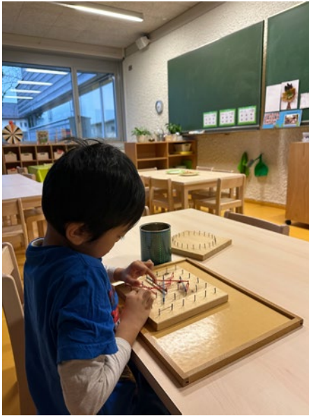
@ Kindergarten Dorf

Sonstige Dokumente, die vom Bund mit Zustimmung des Land Vorarlberg zur Verfügung gestellt werden.