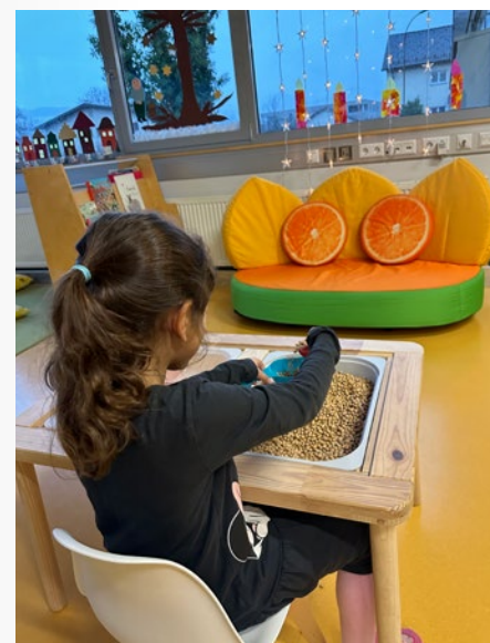
Sensorische Integration, @ Kindergarten Dorf

Weiterbildung ist eine wichtige Ressource für das Personal unseres Kindergartens. Wir sind bemüht uns nach den neuesten wissenschaftlichen Erkenntnissen weiterzuentwickeln. Verschiedene pädagogische Ausrichtungen, die in unsere tägliche Arbeit einfließen, sind unter anderem: